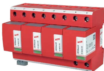
Щиток с комбинированным УЗИП DV M TNS 255 FM